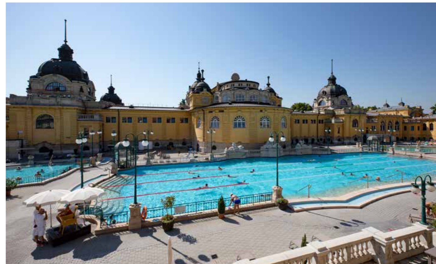
A Széchenyi fürdő Czigler-szárnyának hátsó homlokzata