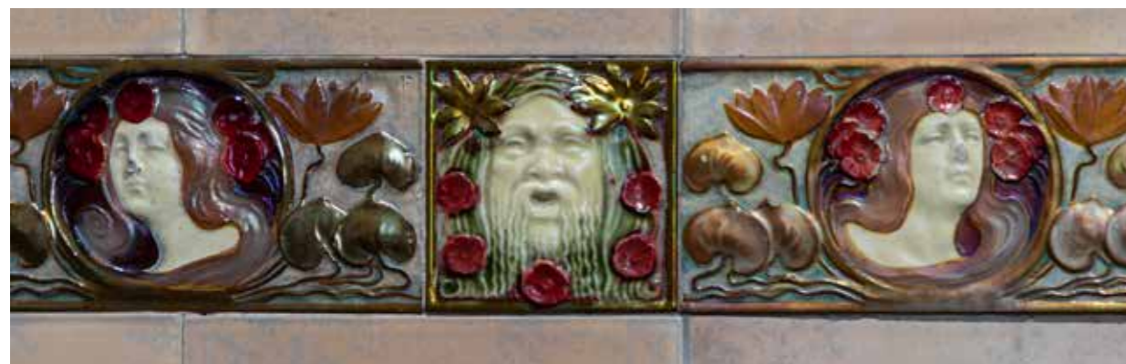
Zsolnay csempek a Széchenyi fürdő bal kupolacsarnokában

A fő kupolacsarnokba egy timpanonos portikuszon át lehet belépni. Orommezéjében Budapest címere látható, növényi ornamentikába foglalva. A kupolacsarnok fölött kívülről attika húzódik, melynek sarkain vörösréz lemezekből készült tritonkompozíciók állnak. Ezek Vastagh György, Bezerédy Gyula, Lányi Dezső és Szentgyörgyi István munkái. A nyolcszögletű kupoladob sarkain kővázák, nagy, szegmensíves záródású termaablakai fölött pedig kőhattyúk kaptak helyet. További vörösréz hattyúkat találunk a sarokrízalitok portikuszai fölött. Az itteni kisebb kupolák négyzetes dobjai oldalán termaablakok nyílnak, lemetszett sarkain pedig vörösréz delfineket láthatunk. A delfinek és hattyúk Markup Béla művei. 783