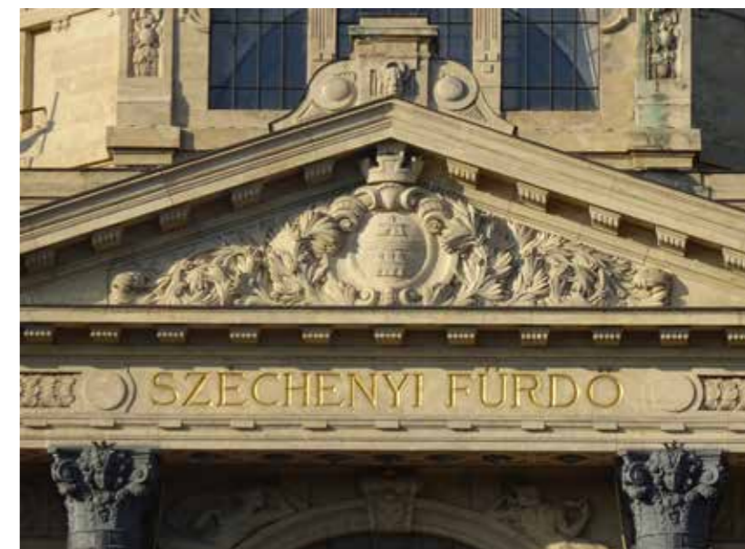
Fent a Széchenyi fürdő bejárati portikuszának timpanonja

A fürdő alaprajza téglalapba írható, melyhez északon egy-egy népfürdői szárny kapcsolódik. Középen egy udvar található, melyet az öltözőket magába rejtő szárny elfelez. A téglalap sarkain négyzetes kupolacsarnokok kaptak helyet. A középtengelyben délen a fő kupolacsarnok, északon pedig egy félköríves, apszisszerű egység található.