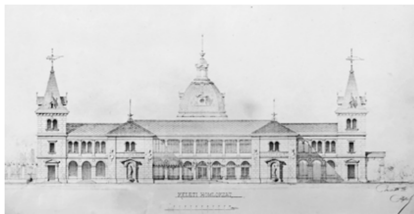
Fent a Nádor fürdő hátsó homlokzata Czigler 1884-ben készült tervén (MNL-OL); lent a városligeti artézi fürdő egyik tervváltozata az 1890-es évekből (BFL)

csarnok. Ennél a tervnél is számoltak a kiállítási pavilon megtartásával, illetve a régi fürdőépületnek is új funkciót terveztek: gépházként szolgálhatta volna az újat. 767 Ugyanebben az évben Cziglernek konkurenciája is akadt: egy vállalkozó bérbe akarta venni a területet, hogy világfürdőt emelhessen rajta. Annyi volt a kérése, hogy más tervezőkkel ne tárgyaljon a főváros. 768