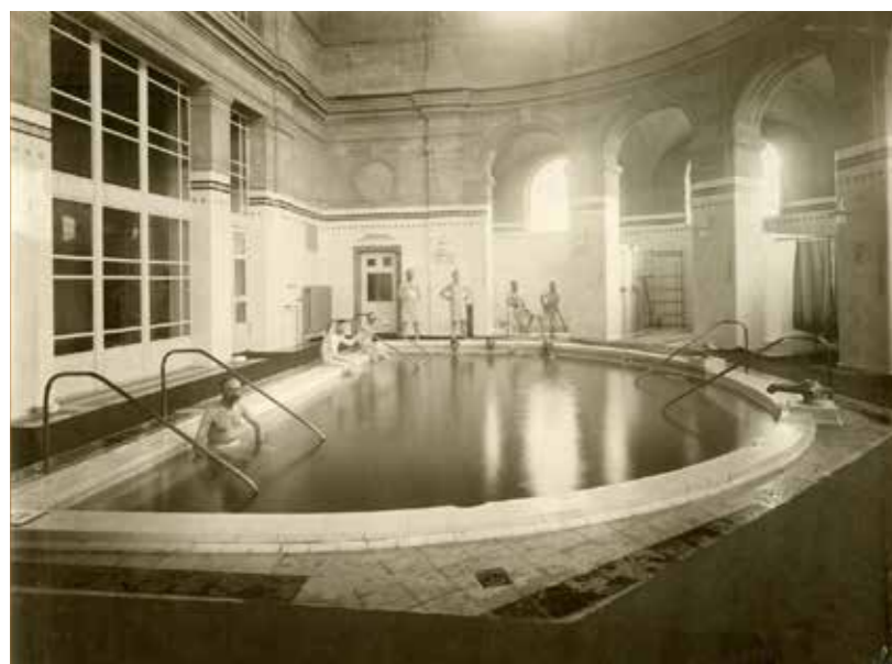
Férfi termál gőzfürdő 1913-ban