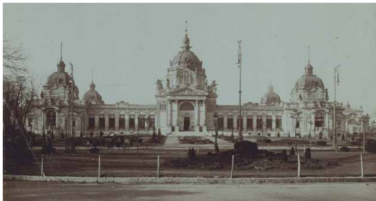
A Széchenyi fürdő 1913-ban